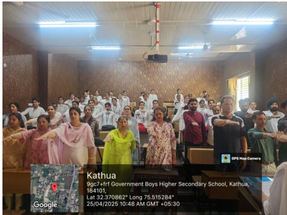
Kathua 99c77f1f1 Government Boys Higher Secondary School, Kathua, 184101, Lat 32.370862° Long 75.515284° 25/04/2025 10:48 AM GMT +05:30